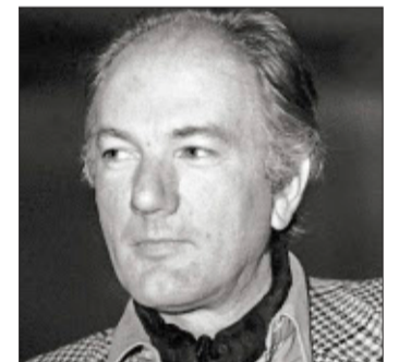
Thomas Bernhard